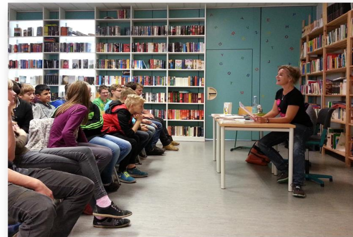
...unser Lesefest in Klasse 6

In der modern eingerichteten schuleigenen Mediothek ist die Gemeindebibliothek von Michelbach integriert.