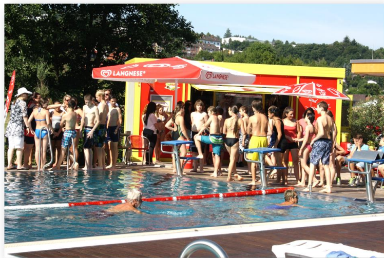
...unser alljährliches Schwimmbadfest